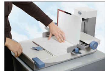
Umschlaghalter und Buchblockhalter (Magnethalter) beiliegend.