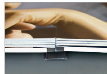
Das fertige Buch lässt sich plan liegend auf 180° öffnen.