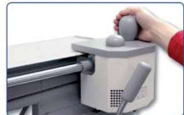
Einfaches + sicheres Leimauftragen.