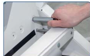
Vordefinierte Stellen für den Papierstopper.