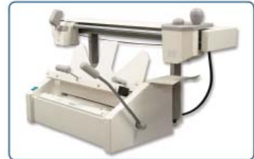
Tischbindemaschine nach Bedarf.

** abhängig von der Materialzusammensetzung