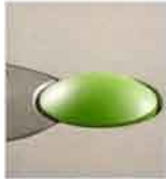
ONE TOUCH FUNKTION

Der Fastback 20 ist die ideale Bindemaschine für Unternehmen wie, Finanzinstitute, Versicherungen, Banken, Treuhandbüros, Architekten, Ingenieurbüros, Copyshops, Digital-Druckgewerbe, Universitäten, und Fachschulen die professionelle Präsentationen benötigen. Um Jahrbücher oder gebundene Dokumente in einem Bruchteil der Zeit zu binden als mit Draht-, oder Plastikbindungen. Diese Maschine bietet beispiellose Benutzerfreundlichkeit mit ihrem LCD-Display welches den Anwender durch jeden Vorgang mit animierten Illustrationen führt. Der Fastback 20 arbeitet mit allen Powis Bindematerialien. Ob mit dem vielseitigen Super Strip dem neuartigen Image-Strip, oder mit dem Perfect-Back zum erstellen von Hardcover-Bücher. Es kann alles von einem einfachen Bericht bis zu einem 350-Blatt-Hardcover Buch erstellt werden.