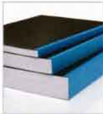
NUR 3 BINDESTREIFEN VON 3-340 BLATT