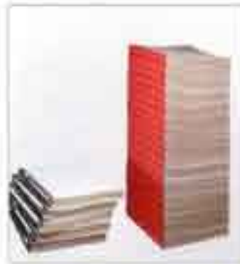
3,5 MAL SCHNELLER ALS WIRO ODER PLASTIK BINDUNGEN